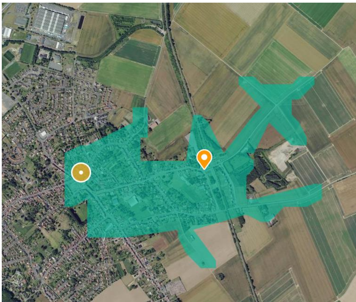
Isochrone d'accessibilité piétonne

La carte isochrone identifie sur la commune un espace tampon de 1 km (en bleu ci-dessous), qui correspond à la zone d'accessibilité de la gare, où l'urbanisation doit être densifiée. Les trois principaux secteurs de développement sur Vimy sont situés à l'intérieur de cet espace tampon. Le PLU de Vimy incite ainsi à l'utilisation des transports en commun et par conséquent, à la réduction de l'usage de la voiture.